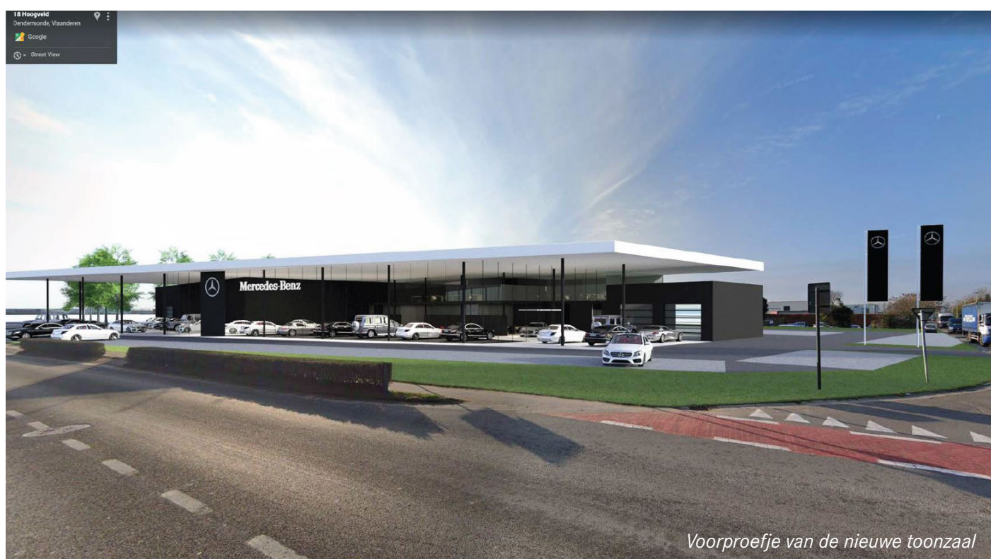
Voorproefje van de nieuwe toonzaal

Wij bieden steeds een aantrekkelijke verloning en extralegale voordelen. Solliciteren kan door uw cv te mailen naar vacature@dendermonde.mercedes-benz.be .